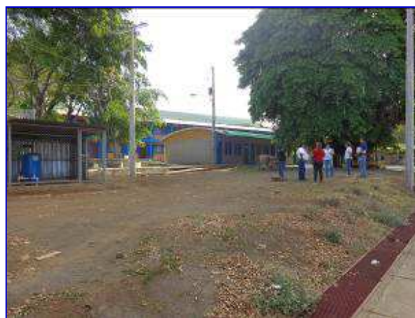
Vista panorámica del terreno donde se construirán los servicios sanitarios, situación sin proyecto.

El proyecto consiste en dotar de vestidores adecuados para los deportistas del Volibol de Playa; así como servicios sanitarios y gradería techada para el público en general, ampliándose la capacidad de gradería existentes de 422 personas a 580 espectadores.