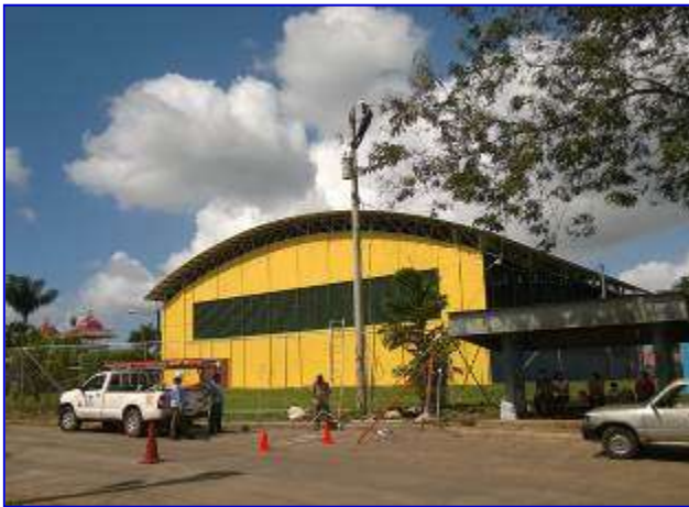
Vista Panorámica del Gimnasio Multiusos, durante la finalización de los trabajos de media tensión.

El proyecto fue ejecutado por el Contratista PROYENITSA, por un monto final de C$ 3,754,090.62; sin con adendum N° 1. El 09 de julio inicio la ejecución del proyecto con un plazo de 110 calendario con 110 días calendario.