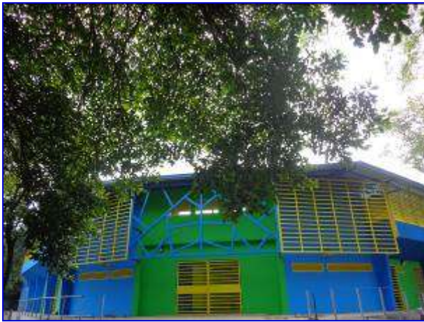
Fachada principal del Estadio Amistad Dodgers ya finalizado.

El proyecto consistió en el Reemplazo del acceso principal y graderías del Estadio de Beisbol Infantil Amistad Dodgers, el cual contará con áreas tales como: vestíbulo de acceso, graderías bajo techo, palco, cabina de transmisión, 6 bodegas bajo graderías, 2 dugouts para los atletas dotados de vestidores y servicios sanitarios, 4 Baterías de servicios sanitarios para el público, área para técnicos, pasillos de circulación,