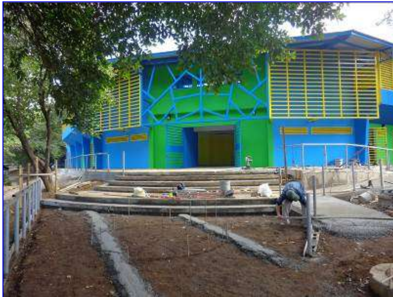
Vista panorámica de la construcción del acceso principal al Estadio Amistad Dodgers, observar las gradas, rampas y barandal metálico.

El 31 de diciembre 2015 se realizó la recepción sustancial del proyecto, quedando pendiente recepcionar las obras en el mes de enero del 2016.