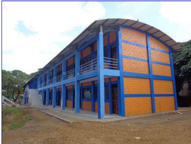
Vista panorámica del edificio de dos plantas del ENEFYD, donde se observa la instalación de barandal metálico, puertas, piso, andenes perimetrales y aplicación de la pintura,

Se continuó con los trabajos de instalación de piso, cielo falso, puertas, ventanas, pintura, obras exteriores, sistema de bombeo hidroneumático. Con un avance físico del 94.52% de ejecución total.