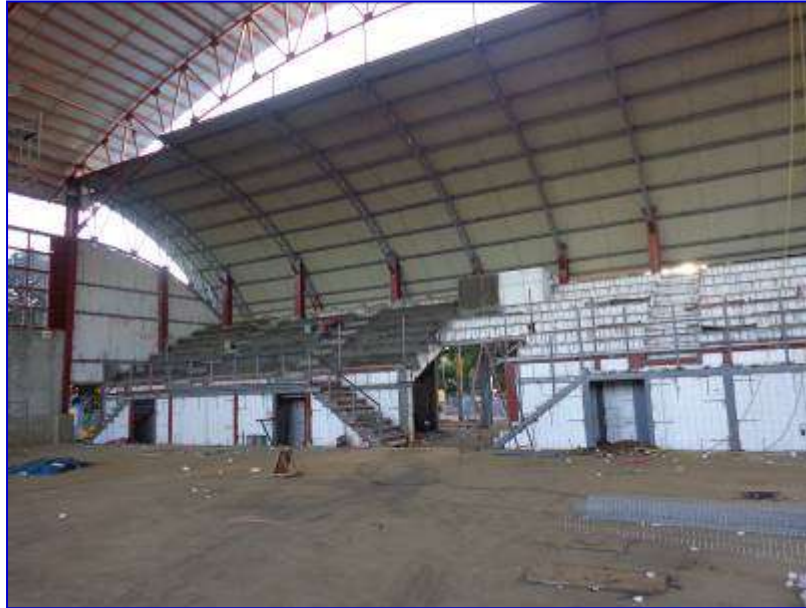
Vista panorámica de la gradería y estructura de techo.

Consiste en ampliar la Cancha de Volibol mediante la construcción de 289 m 2 de gradería en el extremo este, para una capacidad de 383 personas. Contará, La planta baja de gradería constará con los ambientes de oficina de la federación de Volibol y área para técnicos oficinas administrativas, sala de uso multiple, bodegas, servicios sanitarios y vestibulo de acceso.