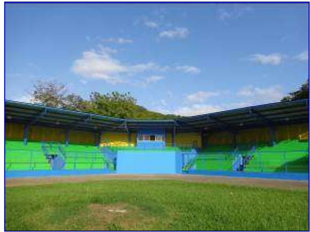
Vista panorámica de las graderías, área de cabina y palco VIP ya finalizados.