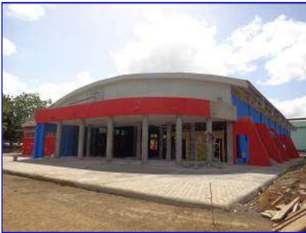
Vista panorámica del Gimnasio de Gimnasia, observar acceso principal, plazoleta, andenes de conexión.

La obra inicio el 23 de junio 2015, con un plazo ejecución con Adendum N° 1 de 149 días calendario; sin embargo, en el mes de noviembre se concedio extensión de plazo de 30 días calendario, teniendo previsto finalizarlo el 20 de diciembre 2015.