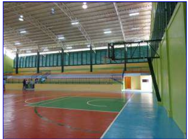
Vista interna del Gimnasio, donde se aprecia la cancha y área de graderías, ya finalizado.

En el mes de diciembre se realizaron los trabajos de media tensión logrando así finalizar la obra y realizar la recepción final del proyecto el 16 de diciembre 2015, recibiendo las obras a entera satisfacción del dueño. En este período se tiene un avance físico financiero del 100.00 %.