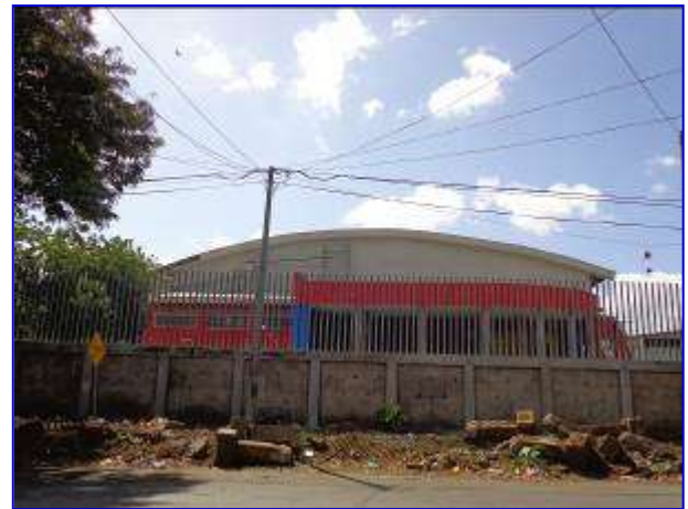
Observar en primer plano la construcción del muro perimetral de las instalaciones del Gimnasio de Gimnasia.

En este periodo se tiene un avance físico – financiero del 23.60 %, correspondiente a la ejecución de las etapas de construcción de muro perimetral, plazoleta, instalación de puertas, accesorios eléctricos, pintura.