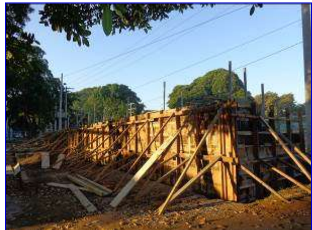
Vista panorámica de gradería costado Este donde se aprecia la construcción del muro de retención para ampliación de la gradería.

Se pagó el Avalúo No. 3 por un monto de C$ 141,868.52 que corresponde a un avance físico del 13.53 % para un avance total del 50.47%.