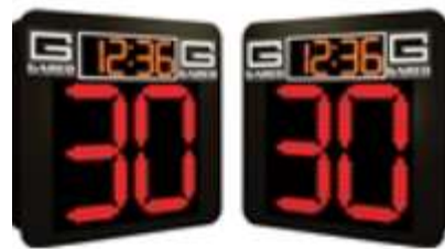
Suministro e instalación de pizarras electrónicas.

En el mes de noviembre se tenía previsto la instalación del equipamiento; sin embargo, debido a que se concedió extensión de plazo al contratista del proyecto Construcción del Gimnasio de Gimnasia Olímpica en el Polideportivo España, queda pendiente la instalación del equipamiento una vez se reciban las instalaciones del Gimnasio de Gimnasia a entera satisfacción del IND.