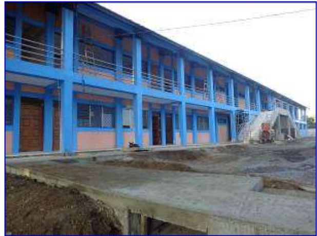
Vista panorámica del edificio de dos plantas del ENEFYD, donde se observa la instalación de ventanas, puertas, construcción de andenes de conexión, aplicación de la pintura,

En el mes de noviembre se tenía previsto la finalización del proyecto; sin embargo, el contratista incumplió por tal motivo se solicitó la entrega a inicios del mes de diciembre.