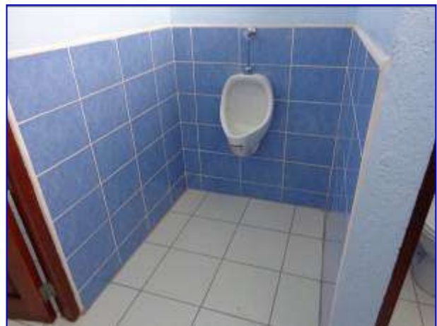
Vista interna de urinario para el público.

En el mes de noviembre aunque se realizaron las gestiones en DISNORTE - DISSUR para agilizar los trabajos de media tensión, no se pudieron concluir por falta de permiso para realizar el despeje de las líneas, se tiene previsto la finalización del proyecto a inicios del mes diciembre.