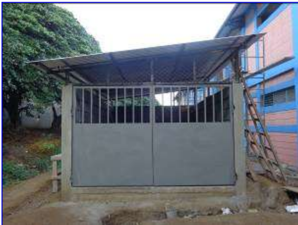
Apreciar la construcción de la caseta para el equipo de bombeo hidroneumático.

Así mismo, se continuó con los trabajos de instalación de piso, cielo falso, puertas, ventanas, pintura, obras exteriores.