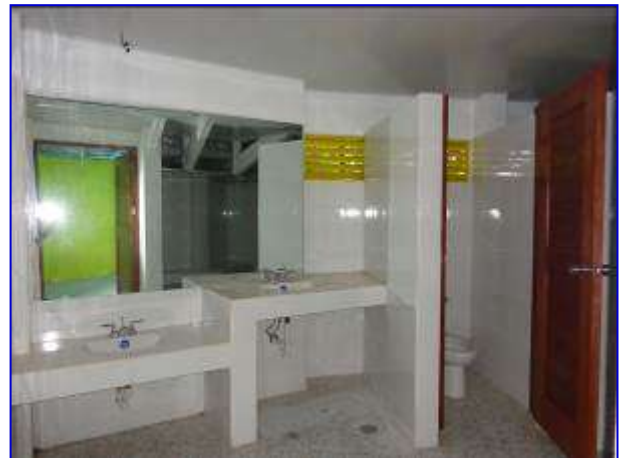
Vista interna del servicio sanitario de mujeres, donde se observa la colocación de azulejos en paredes, piso cerámica, lavamanos, espejos, inodoros, cielo falso y puerta de madera.

Se realizó pago en concepto de avaluo por un monto de C$ 636,151.96, correspondiente a un avance de ejecución físico - financiero del 9.64%, para un avance total de 91.61%.