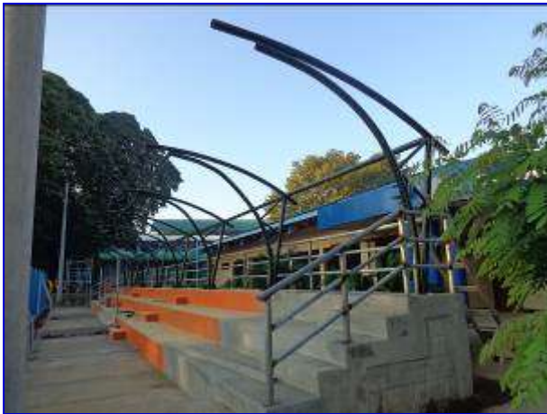
Vista panorámica de gradería costado Oeste, donde se aprecian la ampliación de graderías, colocación de estructura de techo y barandal metálico

El proyecto consiste en la ampliación de graderías existentes, el sistema constructivo será de mampostería reforzada. En ambas graderías se instalarán columnas de tubos metálicos como estructura de soporte de techo y como cubierta lonas resistente a la intemperie a base de fibras de poliéster. Con la ampliación de ambas graderías se incrementa la capacidad a 422 personas sentadas, logrando un 57% más del actual.