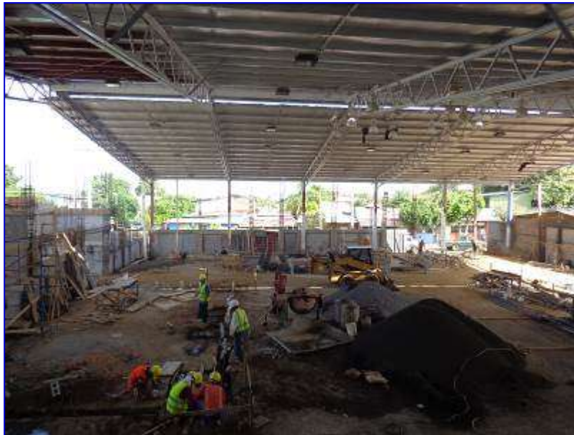
Vista panorámica de la construcción del Gimnasio de Boxeo, donde se aprecia la ejecución de las etapas de fundaciones, estructura de concreto, mampostería.

El 03 de agosto 2015 se inicio la ejecución del proyecto, con un plazo de ejecución de 147 día calendario, sin embargo en el mes de noviembre se amplio el plazo en 45 días, para un total de 192 días calendario, se tiene previsto la finalización el 10 de febrero 2016.