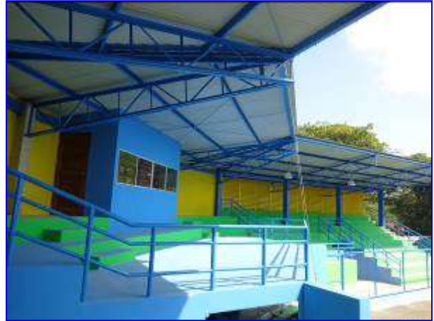
Vista panorámica del área de cabina, palco VIP y graderías costado norte.