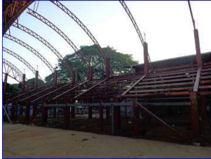
Vista panorámica de la estructura metálica de gradería, estructura de techo.

Consiste en ampliar la Cancha de Volibol mediante la construcción de 289 m 2 de gradería en el extremo este, para una capacidad de 383 personas. Contará, La planta baja de gradería constará con los ambientes de oficina de la federación de Volibol y área para técnicos oficinas administrativas, sala de uso multiple, bodegas, servicios sanitarios y vestibulo de acceso.