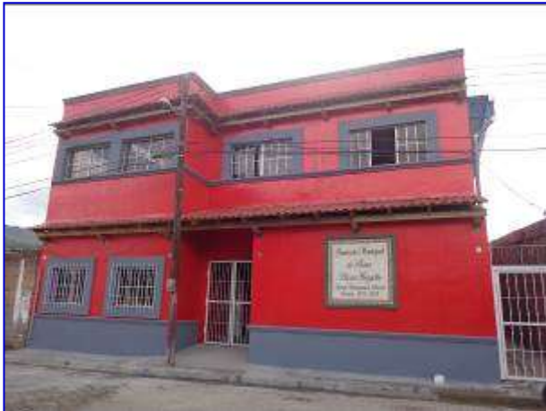
Fachada principal del Gimnasio de Boxeo en Somoto, con el proyecto ya finalizado.

Esta siendo ejecutado por el Contratista Tomás Robleto Lira, por un monto de C$ 3,264,263.71, se realizó adendum N° 1 al contrato por un monto de C$ 639,401.54, para un monsto total de C$ 3,903,665.25. El plazo de ejecución del proyecto es de 98 días calendario, se concedio ampliación de plazo de 30 días, para un total de 128 días calendario.