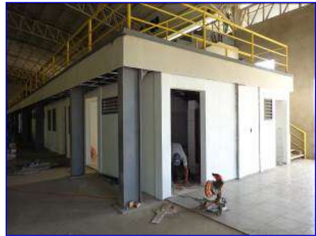
Observar vista interna del área de oficinas. Apreciar colocación de piso, fascia.

La obra inicio el 23 de junio 2015, con un plazo ejecución con Adendum N° 1 de 149 días calendario; sin embargo, en el mes de noviembre se concedio extensión de plazo de 30 días calendario, teniendo previsto finalizarlo el 20 de diciembre 2015.