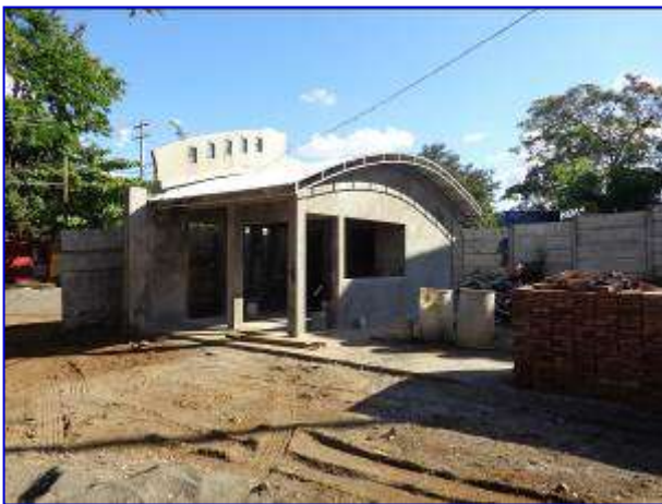
Vista panorámica de la caseta de vigilancia en el Gimnasio de Gimnasia.