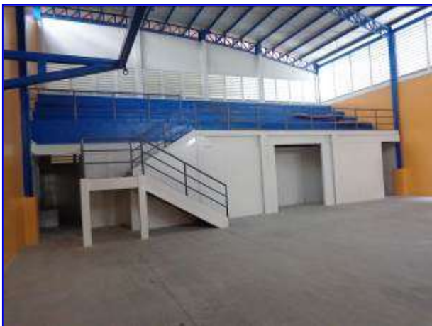
Vista interna del gimnasio con el proyecto ya finalizado.

El 23 de noviembre 2015 se realizó la recepción final del proyecto, recibiendo las obras a entera satisfacción.