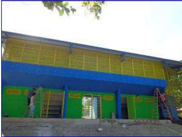
Fachada principal costado norte del Estadio Amistad Dodgers, observar la instalación de los portones, pintura.

El proyecto consiste en el Reemplazo del acceso principal y graderías del Estadio de Beisbol Infantil Amistad Dodgers, el cual contará con áreas tales como: vestíbulo de acceso, graderías bajo techo, palco, cabina de transmisión, 6 bodegas bajo graderías, 2 dugouts para los atletas dotados de vestidores y servicios sanitarios, 4 Baterías de servicios sanitarios para el público, área para técnicos, pasillos de circulación,