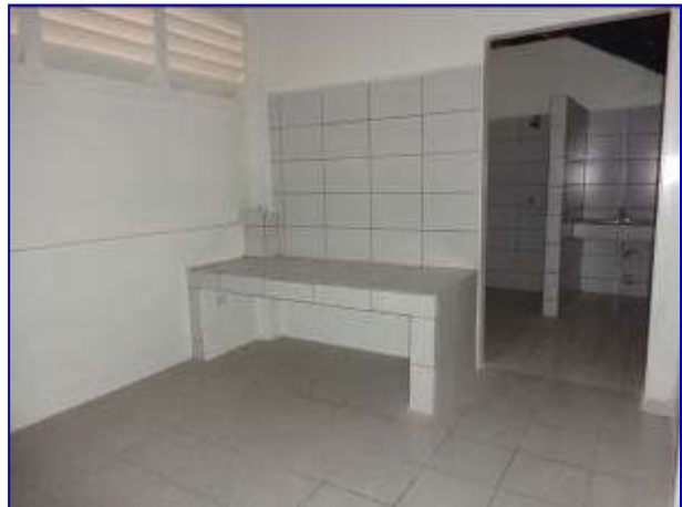
Vista interna del área de camerino, donde se aprecia en primer plano la banca para masajes, y al fondo el área de servicios sanitarios.