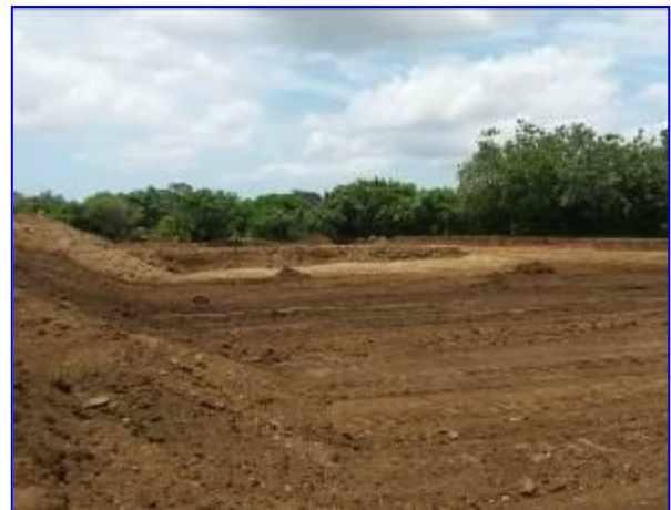
Vista panorámica del campo del estadio de Beisbol Las Jagüitas, donde se aprecia la ejecución de la etapa de corte del terreno.

En este periodo tiene un avance físico – financiero del 20.65%, correspondiente a la ejecución de las obras preliminares y avance en la etapa de movimiento de tierra (corte y relleno).