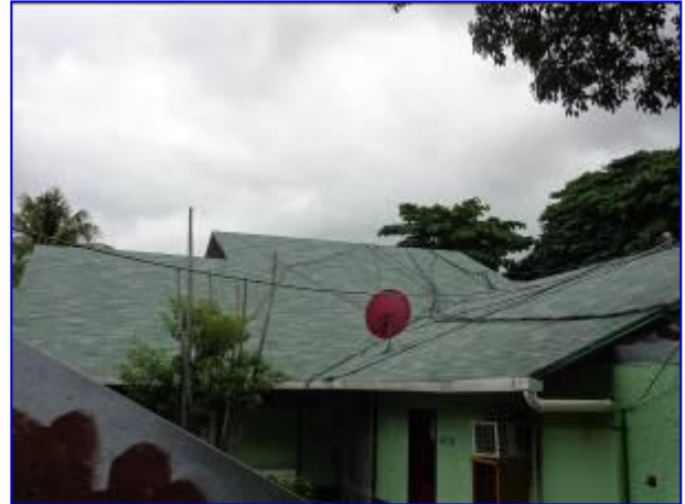
Apreciar el reemplazo de la cubierta de techo del edificio principal del IND (dirección ejecutiva).