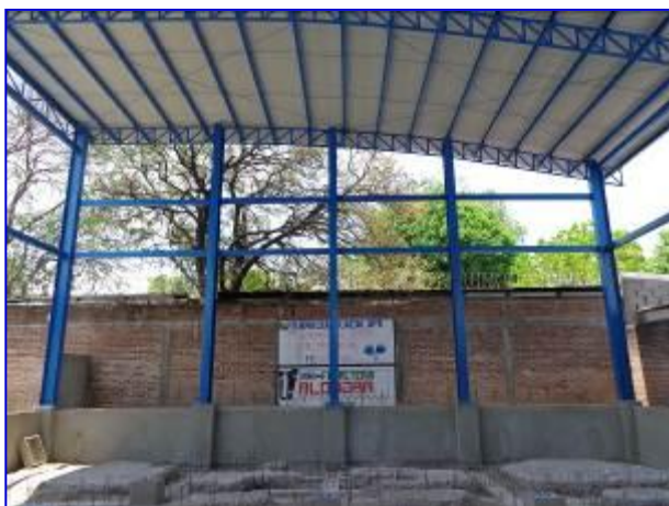
Vista interna del Gimnasio de Boxeo en el municipio de Somoto, con la primera etapa finalizada.

La obra estaba previsto ejecutarse en el año 2014, sin embargo, debido a atrasos ocasionados por el reemplazo de suelo sonsocuite en el terreno del proyecto, se concedió extensión de plazo, logrando así ejecutarse el proyecto en un período de ejecución de 190 días calendario, contabilizado desde el 16 de Septiembre 2014.