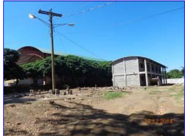
Vista panorámica del terreno donde se construye el edificio del ENEFYD.

En el I Semestre se ha realizado la construcción de fundaciones, vigas, columnas, paredes y escalera de concreto y se continuó con el suministro e instalación de tuberías de aguas negras, aguas potables y obras eléctricas.