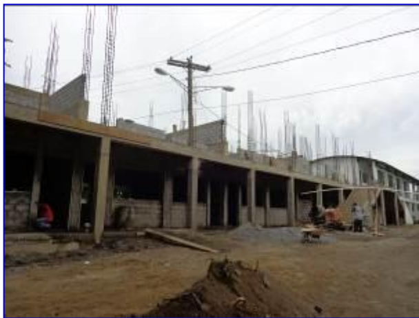
Observar vista panorámica del edificio nuevo del ENEFYD, donde se aprecia la construcción de columnas, vigas, paredes y escalera de concreto.

Se tiene un avance físico financiero del 54.92% de ejecución total. La ejecución de la obras se inicio el 15 de diciembre 2014 y esta prevista a finalizar el 31/05, pero se le concedió ampliación al plazo de 75 adicionales, siendo su nueva fecha de entrega el 15 de Agosto.