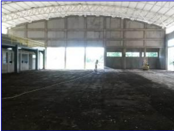
Vista interna del edificio de Gimnasio de Gimnasia, situación sin proyecto.

El proyecto consiste en la construcción de losa de piso, obras sanitarias, obras eléctricas, puertas, ventanas, cielos, pintura y obras exteriores.