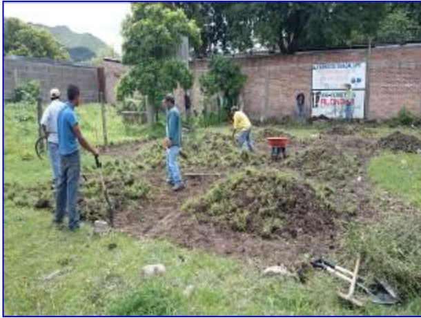
Vista panorámica del terreno donde se construirá el Gimnasio de Boxeo de Somoto.

El proyecto fue ejecutado por el Contratista Inversiones Trujillos Flores Cía Ltda., por un monto de C$ 2,480,177.77.