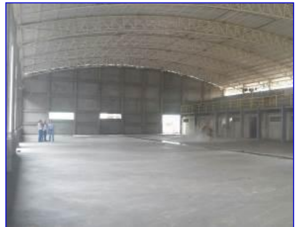
Vista interna del Gimnasio ya con proyecto., donde aprecia la construcción de la losa de concreto de 3000 PSI.

El proyecto consiste en la construcción de losa de piso, obras sanitarias, obras eléctricas, puertas, ventanas, cielos, pintura y obras exteriores.