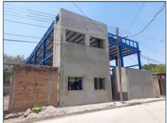
Observar fachada principal del Gimnasio de Boxeo en Somoto, con proyecto ya finalizado (I Etapa).

La primera etapa del proyecto finalizó el 17 de abril 2015, habiéndose ejecutado durante las etapas desde sus cimientos hasta la construcción de paredes de fachada principal y techo.