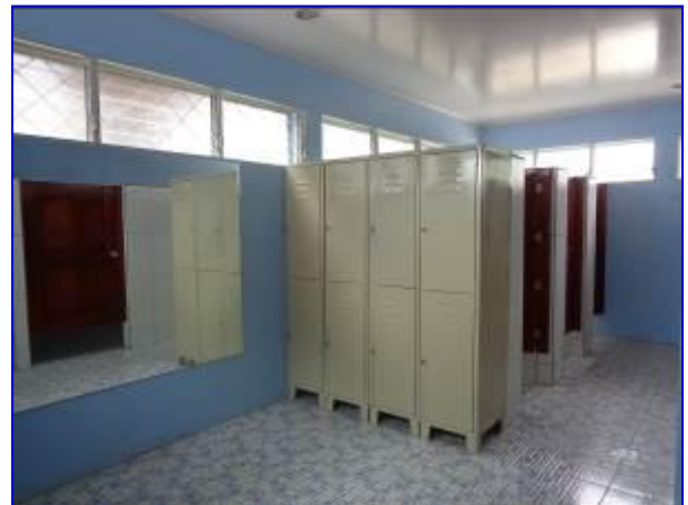
Vista interna del edificio de Vestidores y Batería Sanitarias ya finalizado, donde se observa la instalación de espejo biselado, locker para deportistas y área de duchas.