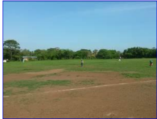
Vista panorámica del campo del estadio de beisbol Las Jagüitas sin proyecto.

En este periodo tiene un avance físico – financiero del 20.65%, correspondiente a la ejecución de las obras preliminares y avance en la etapa de movimiento de tierra (corte y relleno).