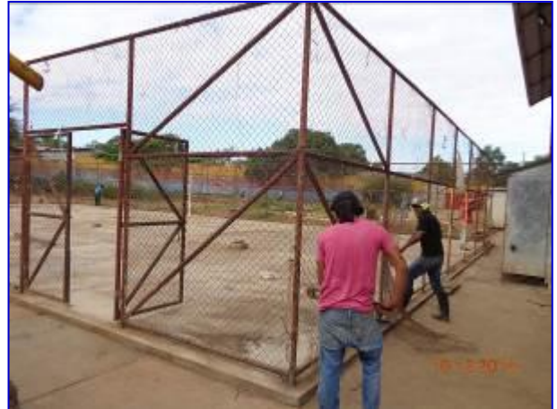
Vista Panorámica del terreno donde se construyó el edificio de Vestidores y Batería Sanitaria.

Fue ejecutado por el Contratista Nelson Antonio Rostran Cruz, por un monto total de C$ 4,386,309.67. El proyecto inició el 15 de diciembre 2014 y finalizó el día 30 de junio 2015, con un plazo de ejecución de 182 días calendario.