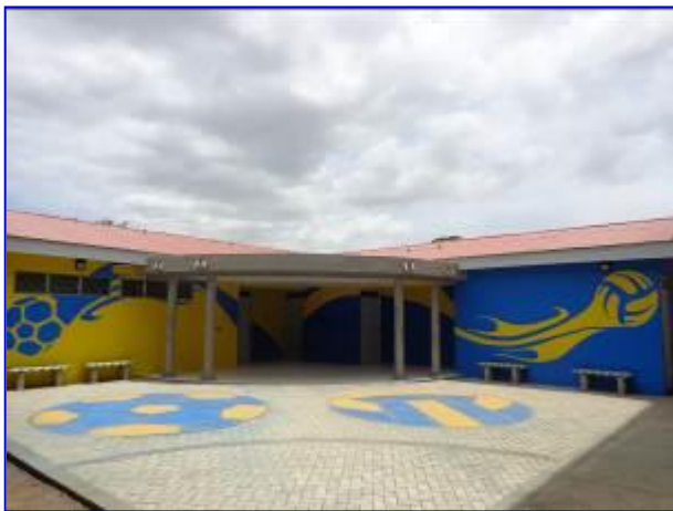
Vista panorámica del edificio del Vestidores ya finalizado, donde se aprecia plazoleta, acceso principal del mismo.

El proyecto consistió en la construcción de los vestidores y servicios sanitarios para los gimnasios de Volibol y Balonmano, y la ampliación de la Cancha de Balonmano por medio de graderías techadas.