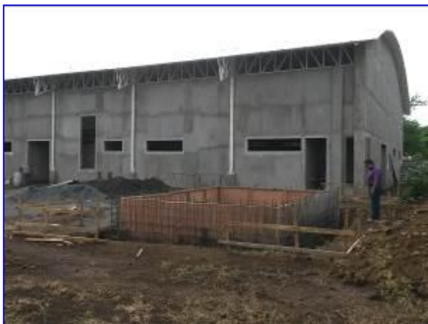
Vista panorámica del Gimnasio de Gimnasia. En primer plano observar la construcción de la cisterna.

Esta siendo ejecutado por el Contratista Tomás Robleto Lira, por un monto de C$ 13,102,665.80. El plazo de ejecución del proyecto es de 119 días calendario. El 23 de junio 2015 se inicio la ejecución de plazo y se tiene previsto la finalización del proyecto para el 20 de octubre 2015.