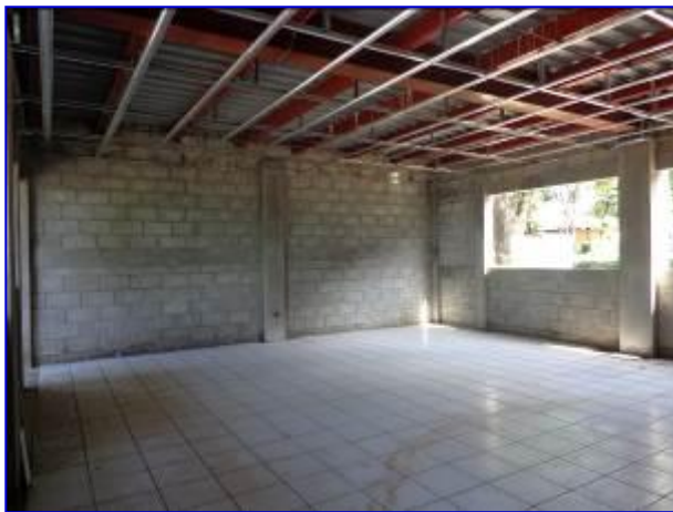
Vista interna del aula de clase donde se aprecia la instalación de piso (cerámica), esqueleteado para instalación del cielo falso.

Se pagó el Avalúo No. 9 por un monto de C$ 954,589.30 que corresponde al 8.58 % de avance físico para acumular el 63.50% de ejecución total.