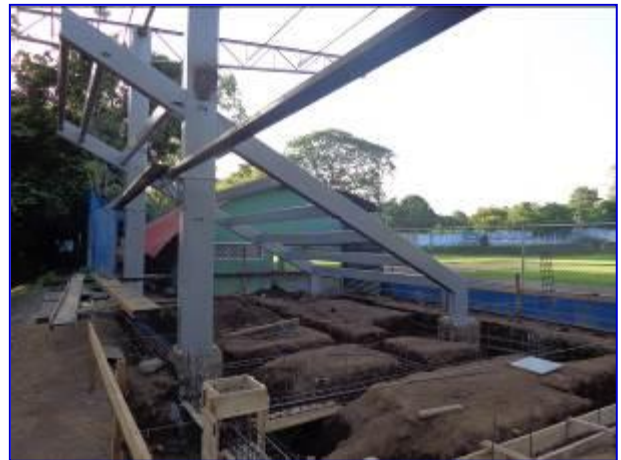
Vista panorámica del área de gradería costado norte, donde se puede apreciar la ejecución de las etapas de fundaciones e instalación de la estructura principal de graderías.