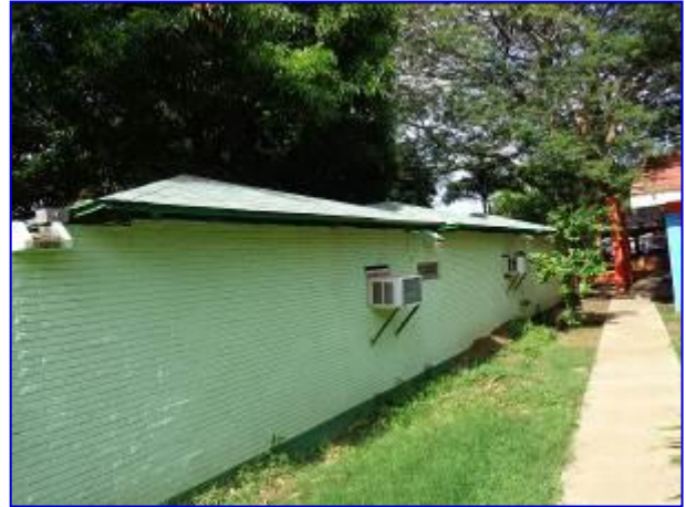
Apreciar el reemplazo de la cubierta de techo del edificio de Asesoría Legal y Delegaciones Territoriales.