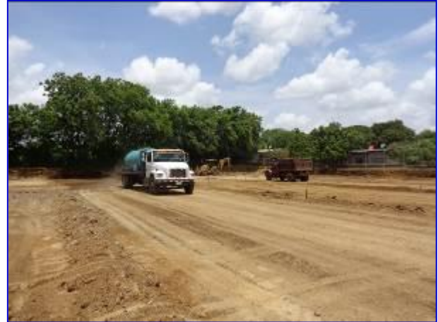
Vista panorámica de la conformación de la terraza del campo de beisbol Las Jagüitas.