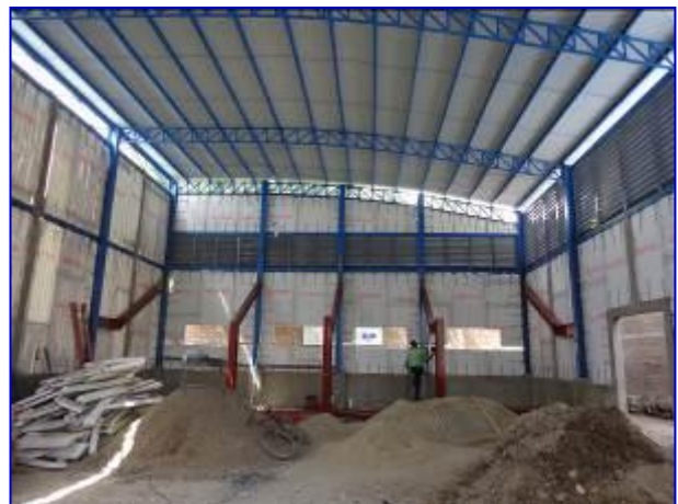
Vista interna del Gimnasio de Boxeo en Somoto, donde se aprecia el suministro e instalación de estructura principal (metálica) de graderías y louvers.