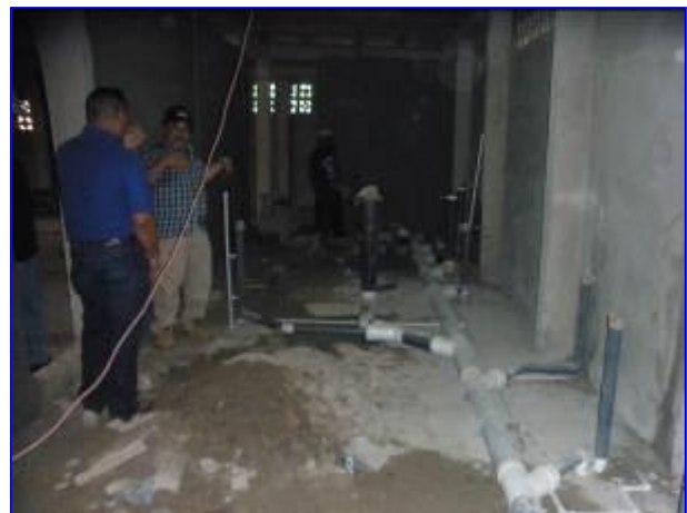
Apreciar la instalación de la tubería de drenaje sanitario.

Al mes de Julio, se tiene un avance en la ejecución físico del 32.29 %, para un avance total en la ejecución del proyecto de 67.29 %. Se continuó con la ejecución de las paredes, graderías metálicas, obras sanitarias, electricidad, acabados.