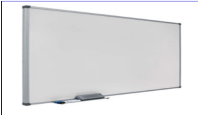
Suministro de 12 pizarras acrílicas con medida de 48" x 96".

Con este proyecto se dotará de equipamiento las aulas de la Escuela Nacional de Educación Física, con sillas y mesas para estudiantes, 12 aires acondicionados, 2 datashow, 8 bancas, casilleros, 12 pizarras acrílicas y cortinas para auditorios.