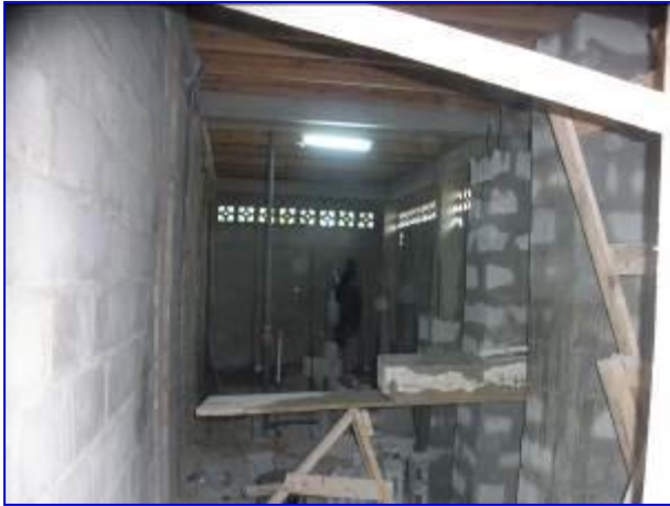
Vista interna de la construcción de batería sanitaria de paredes de bloque de concreto.

El proyecto consiste en la ejecución de la etapa final, la cual contempla las etapas de mampostería, acabados, cielo raso, pisos, puertas, obras metálicas, obras sanitarias, electricidad, obras misceláneas, impermeabilización de techo.