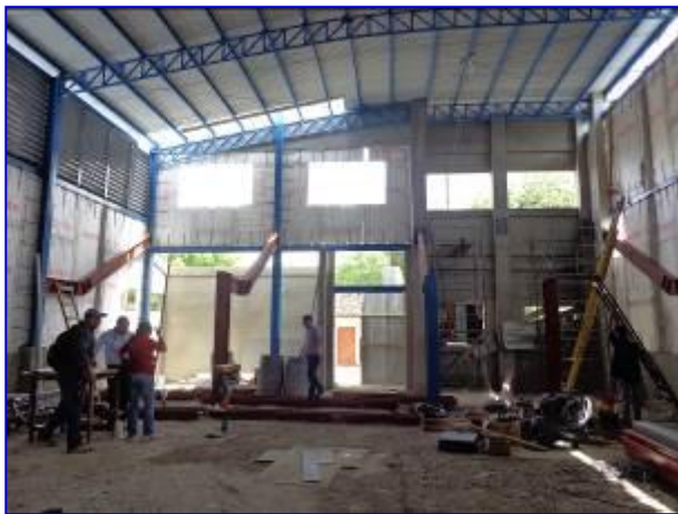
Vista interna del Gimnasio. Observar instalación de estructura principal de gradería, acceso principal.

El proyecto consiste en la ejecución de las etapas de cerramiento fachadas laterales, piso, puertas, ventanas, obras sanitarias, electricidad, graderías y acabados.