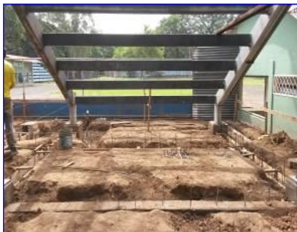
Vista panorámica debajo de gradería costado oeste. Observar la ejecución de las etapas de fundaciones (primer plano) y la estructura principal de graderías (segundo plano).

En este período se continuo con desinstalación de las vigas principales de graderías metálicas, demolición total del modulo de servicios sanitarios. Se inicio con la construcción de las fundaciones y reemplazo de la estructurar metálica de gradería. Se realizó pago en concepto de avaluo por un monto de C$ 720,413.57, correspondiente a un avance de ejecución físico - financiero del 13.10%