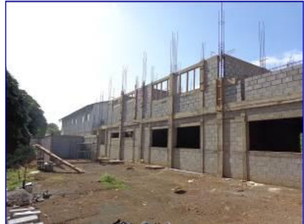
Observar vista panorámica del edificio nuevo del ENEFYD (a la derecha) y la construcción de la caseta de bombeo hidroneumático (a la izquierda).

En este periodo se continuó con el repello y fino, enchape de azulejos, instalación de pisos, cielo falso, suministro e instalación de tuberías y alambrado del sistema eléctrico, construcción de paredes de concreto, se inició la construcción de la caseta del sistema de bombeo hidroneumático.