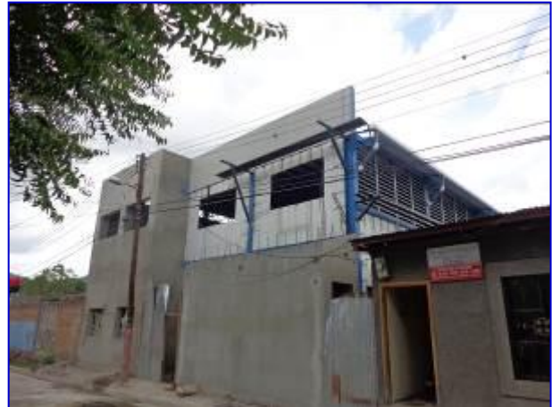
Vista panorámica de las instalaciones del Gimnasio de Boxeo. Observar el suministro e instalación de covintec, louvers y bajantes de canal pluvial.

En este periodo se inició la instalación de vigas metálica, graderías y columnas, se continuó con la instalación de louvers, tuberías de agua potable y aguas negras. Se pagó el Avalúo No. 2 por un monto de C$ 625,644.87 que corresponde al 19.17 % de avance físico para acumular el 42.07 % de ejecución total.