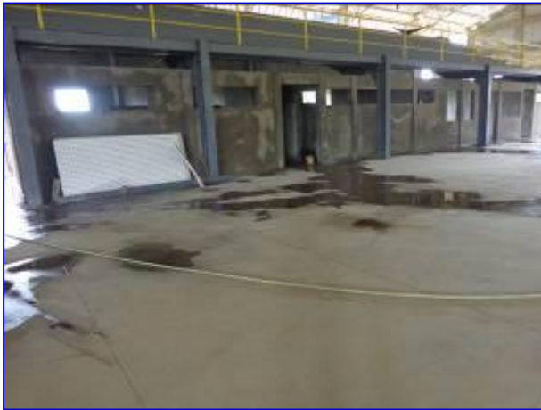
Vista interna del edificio de Gimnasio de Gimnasia, donde funcionarán las áreas de oficinas administrativas y servicios sanitarios (debajo de graderías), ya con acabado de repello y fino.

El proyecto consiste en la construcción de losa de piso, obras sanitarias, obras eléctricas, puertas, ventanas, cielos, pintura y obras exteriores. Esta siendo ejecutado por el Contratista Tomás Robleto Lira, por un monto de C$ 13,102,665.80.