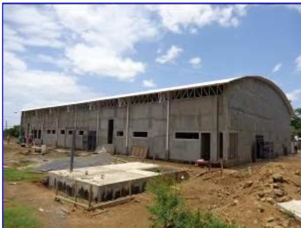
Vista panorámica del Gimnasio de Gimnasia. En primer plano observar la construcción de la cisterna.

El plazo de ejecución del proyecto es de 119 días calendario. La obra inicio el 23 de junio 2015 con un plazo ejecución de 119 días calendario, finalizado el 20 de octubre 2015.